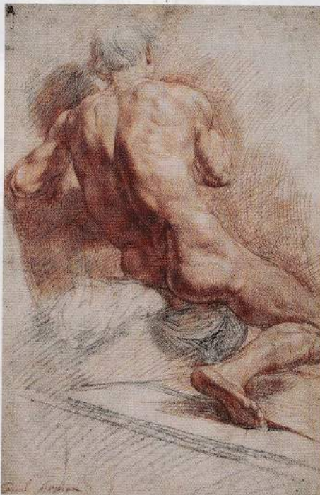
Giuseppe Cesari, dit le Cavalier d'Arpin (1568-1640), Académie d'homme, pierre noire, sanguine 40,2 x 27,2 cm, stand galerie Marty de Cambiaire (Salon du dessin 2017).